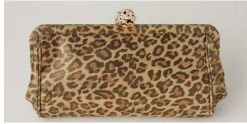
Plush&Lush FREE'S SHOP (本館 B1F) KENNETH JAY LANE クラッチバッグ ¥40,950 11/13～ 無くなり次第終了