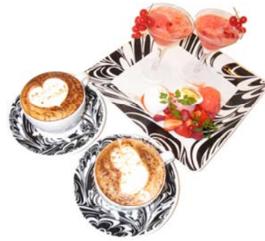
ジェラテリアパールナチュラルビート(本館 3F) ベリーベリークリスマススペシャルプレート ¥2,400(予定) 11/13～12/25