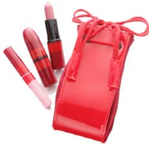
M・A・C (西館 1F) アドアリング カーマイン リップバッグ ¥6,090 11/20～ 限定発売