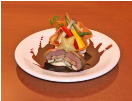
洋食 MIYASHITA (本館 3F) クリスマススペシャルメニュー “Ruby” de Noel ¥10,000 ※12/23、24 はジャズライブ付きで¥15,000 になります。 12/18～12/25