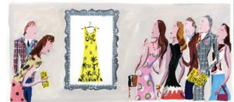
※2周年のイメージヴィジュアル