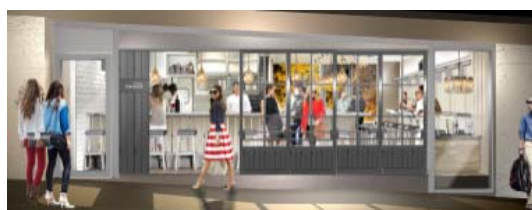
パールアヴァン パルタージェ