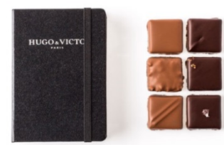
ユーゴ・エ・ヴィクトール