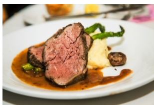
サーティーセブン ローストビーフ

飲食店は、日本初の旗艦店1店舗、新業態4店舗を含む6店舗がオープン。30・40代の女性をターゲットにランチ、ディナーともに充実したメニューを提供する店舗が集結します。六本木の人気ステーキハウスの新業態「サーティーセブン ローストビーフ」は、店頭で専用熟成庫で熟成させた赤身肉の旨みをいかしたローストビーフを提供します。大阪で瞬く間に人気店に駆け上がった新感覚フレンチバー「ル・コントワー」の新業態「パールアヴァン パルタージェ」では、タパス(小皿)サイズの正統派フレンチやヴィンテージワインなどを、リーズナブルな価格で提供します。また、パリの革新的パティスリー&ショコラトリー「ユーゴ・エ・ヴィクトール」は、カフェスペースを併設した日本初の旗艦店を出店。古典的インスピレーションを革新的なデザインに昇華させたスイーツが特徴で、ショコラや着色料不使用のマカロン、厳選された新鮮な食材や季節のフルーツを使用したケーキなどをシーズン毎に提供します。