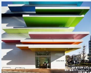
巣鴨信用金庫 志村支店

色を大胆に取り入れた建築(巣鴨信用金庫ほか)、空間デザイン(ABC キッキングスタジオほか)、アート(UNIQLO、ISSEY MIYAKE ほか)など多数のプロジェクトを手掛ける。インスタレーションでは、2013年から100色で空間を構成する「100 colors」に着手。東京の色とレイヤーを初めて見たときの感動を、色の圧倒的な存在感で表現している。2017年1月、国立新美術館「開館10周年記念ウィーク」などでもインスタレーションを手掛けている。