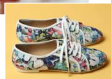
表参道ヒルズ限定商品 (3/7 販売開始)