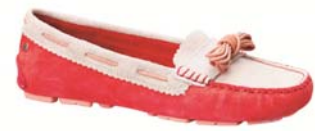
表参道ヒルズ限定商品(3/6販売開始)