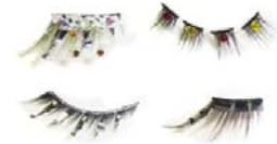
表参道ヒルズ限定カスタマイズ ラッシュ ※イメージ