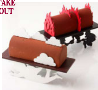
ジャン=ポール・エヴァン (本館 1F) 手前)ピュッシュ デイヴィーヌ 台座付¥10,000(税込¥10,800)、本体のみ¥5,500(税込¥5,940) 奥)ピュッシュ ダンフェール 台座付¥10,000(税込¥10,800)、本体のみ¥5,500(税込¥5,940)

カカオの産地にこだわったショコラムース。天使と悪魔をかたどった台座も全てチョコレートで作られています。 ※予約期間 11/1(日)~12/13(日) ※お渡し期間 12/23(水・祝)~12/25(金) ※ともに数量限定