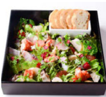
洋食ミヤシタ (本館 3F) オマール海老ととれたてシーフードのフュイデメール ¥2,200(税込¥2,376)

日本三大地鶏の一つ、比内地鶏のガラを使用し、生醤油を合わせたスープが絶品のラーメン。比内地鶏にフォアグラを詰めた特製パロティヌを贅沢にトッピングしました。 ※1日限定10食 ※提供時間 11:00~L.O.22:30(日~L.O.21:30)