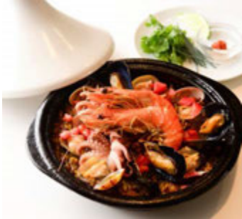
フォービドゥン フルーツ (西館 1F) モロッカシーフードパエリア ¥1,204(税込¥1,300)

大人気のシーフードパエリアがクリスマス限定で復活。オマール海老からとったスープや、アサリ、ムール貝などのうまみがしみ込んだサフランライス、一度食べたらリピート間違いなしです。 ※1日限定10食 ※提供時間 11:00~L.O.20:30(日~L.O.19:30)