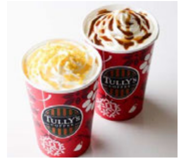
タリーズコーヒー (西館 B1F) 手前)ノエルハニーミルクラテ ¥491(税込¥530)

ドイツから直輸入で取り寄せた伝統のクリスマスケーキ“シュトーレン”と、スパイシーなドイツのホットワイン“グリューワイン”のお得なセット。スパイシーなワインとドライフルーツたっぷりのシュトーレンで体もほかほかに。グリューワインのマグカップは、プラス¥500(税込¥540)でお持ち帰りも可能です。 ※提供時間 11:00~L.O.22:30(日~L.O.21:30)