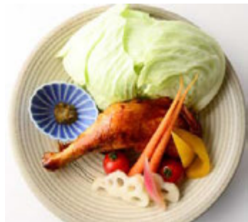
京 お野菜バル めい (本館 3F) 冬キャベツと鶏もものチョコキチヨキ ピクルス添え ¥1,556(税込¥1,680)

ロースターキーハムに、オリジナルのクランベリーソースとクリームチーズ、ルッコラを合わせた、クリスマス限定バーガーとフレンチフライのセット。クリスマスの王道料理、ロースターキーを手軽にお楽しみいただけます。 ※提供時間 11:00~L.O.22:00(日~L.O.21:00)