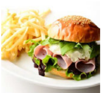
ゴールデンブラウン (本館 3F) ロースターキーバーガー クランベリーソース ¥1,167(税込¥1,260)

フィレとサーロインの2種類の部位が楽しめるボリュームたっぷりのTボーンステーキが登場。クリスマスパーティーでがっつり、皆でシェアしてお召し上がりください。 ※提供は600g~ ※1日限定10食 ※提供期間 11/5(木)~12/22(火) ※提供時間 17:00~L.O.22:30(日~L.O.21:30)