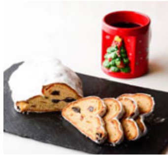
レーゼン ヴァルト (本館 B3F) シュトーレン&グリューワインセット ¥1,500(税込¥1,620)

赤・白・緑のクリスマスカラーが可愛い、あんちゅベリークリスマスパフェ。キャラメル寒天ゼリーをベースに、求肥やあんぱースト、ラズベリーのアイス、フルーツなどを合わせました。もちもちとした求肥、パリッとしたアーモンドとごまのキャラメリゼなど、様々な食感もお楽しみいただけます。 ※提供時間 11:00~L.O.21:30(日~L.O.20:30)