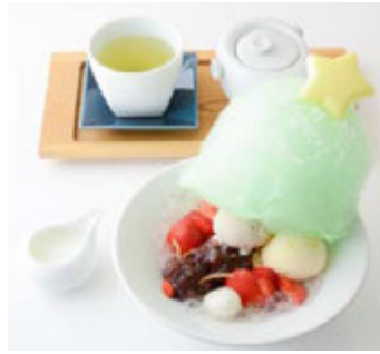
R style by 両口屋是清 (本館 3F) クリスマスパルフェ ¥1,389(税込¥1,500)

キャラメル風味のミルクチョコレートムースを濃厚なカシスソースでコーティング。自家製のアーモンドフィナンシェとピスタチオアイスクリーム、マカロン生地で作った雪だるまとサンタクロースのクッキーを添えました。 ※提供時間 14:00~L.O.21:30(日~L.O.20:30)