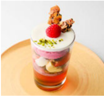
トラヤカフェ (本館 B1F) クリスマスパフェ ¥1,100(税込¥1,188)

チョコレートチャンクピザ、バナナワッフル、ストロベリークレープ、チョコレートフォンデュなど人気のメニューを、少しずつワンプレートで提供。2~3名様ほどのボリュームがあるため、シェアしてお楽しみください。 ※提供期間 11/5(木)~通年展開 ※提供時間 11:00~L.O.22:00(日~L.O.21:00)