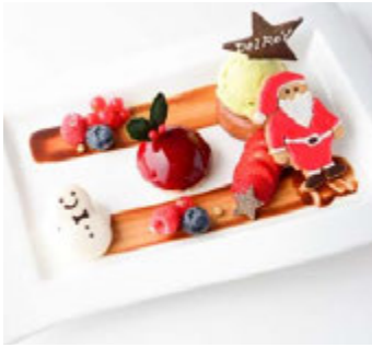
デルレイ カフェ & ショコラティエ (本館 3F) プレゼント フローム サンタクロース ¥1,482(税込¥1,600)

キャラメル風味のミルクチョコレートムースを濃厚なカシスソースでコーティング。自家製のアーモンドフィナンシェとピスタチオアイスクリーム、マカロン生地で作った雪だるまとサンタクロースのクッキーを添えました。 ※提供時間 14:00~L.O.21:30(日~L.O.20:30)