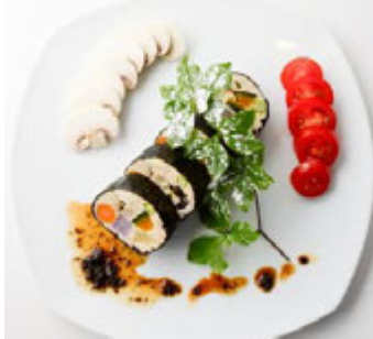
やさい家めい (本館 3F) 冬野菜たっぷりミートローフ ¥1,790(税込¥1,933)

大人気のシーフードパエリアがクリスマス限定で復活。オマール海老からとったスープや、アサリ、ムール貝などのうまみがしみ込んだサフランライス、一度食べたらリピート間違いなしです。 ※1日限定10食 ※提供時間 11:00~L.O.20:30(日~L.O.19:30)