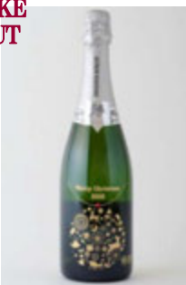
はせがわ酒店 (本館 3F) 高島 嘉(たかはた よし)スパークリング 2015 クリスマス限定ボトル ¥4,000(税込¥4,320)

山形県高島町の完熟シャルドネを100%使用した、淡いレモンイエロー色の本格スパークリングワイン。クリスマスの様子がエッチングされたボトルは、パーティーのお供に最適です。 ※販売時間 11:00~21:00(日~20:00)