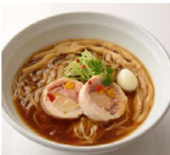
ラーメンゼロ PLUS (本館 3F) 比内地鶏スープとフォアグラテリーヌのクリスマスラーメン ¥1,481(税込¥1,600)

山椒風味で仕上げた骨付き鳥もも肉の照り焼きに、野菜のピクルスを添えました。鳥もも肉とピクルスをはさみでお好みの大きさにカットし、キャベツにくるんでお召し上がりください。 ※1日限定10食 ※提供期間 12/1(火)~12/25(金) ※提供時間 17:00~L.O.22:30(日~L.O.21:30)