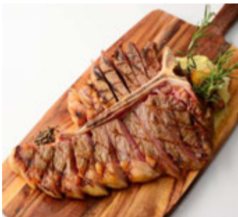
サルヴァトーレ クオモ (本館 3F) Tボーンステーキ ¥6,800~(税込¥7,344~)

赤ワインと香味野菜でじっくりと煮込んだ、とろけるように柔らかい牛ホホ肉の煮込み。仕上げに火を付けたバターをかけてサーブする演出がディナーをより一層盛り上げます。 ※提供時間 17:00~L.O.22:30(日~L.O.21:30)