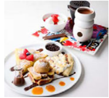
マックス プレナー チョコレートバー (本館 1F) フェイスリットパーティープレート ¥2,777(税込¥3,000)

クリスマスツリーをイメージした綿菓子が可愛らしいパルフェ。ライスミルクのソースをかけると綿菓子の中から、隠れていたあんのできたトナカイやアイスクリーム、いちごなどのフルーツが出てきます。※ドリンク付き ※提供時間 11:00~L.O.21:30(日~L.O.20:30)