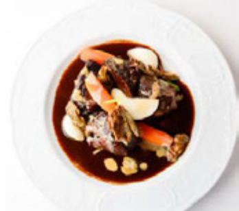
レーゼン ヴァルト (本館 B3F) 牛ホホ肉の赤ワイン煮込み~炎と共に~ ¥2,400(税込¥2,592)

人参、かぼちゃ、ごぼうなどの冬の根菜類約8種類を、国産鶏のミンチに詰め込み、海苔で巻いた和風ミートローフ。トリュフで香りづけした特製の和風ダレをつけてお召し上がりください。 ※1日限定10食 ※提供時間 17:00~L.O.22:30(日~L.O.21:30)