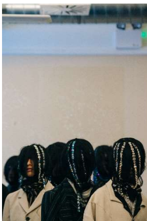
KIKO KOSTADINOV 19/20AW