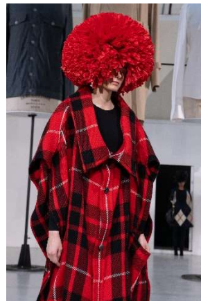
ANREALAGE 2019-20 A/W Collection