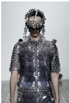
ANREALAGE 2019 S/S Collection