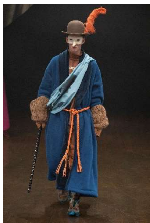
UNDERCOVER 19/20AW Mens Collection