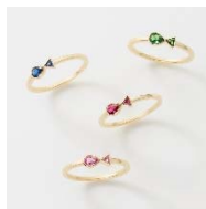
プチポワソンリング

■54,000円(税込)以上お買い上げのお客様にオリジナルミラーをプレゼントします(数量限定)。