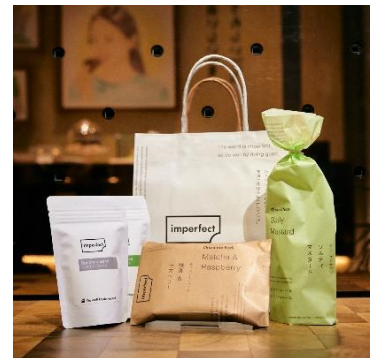
インパーフェクト (同潤館 1F) 1,000円 (1,340円相当) 各日限定10個 2,000円 (2,860円相当) 各日限定10個 ※2,000円の福袋の中身イメージです。

※福袋には、ワイン1本が入っています。 ※5,000円の福袋の中身イメージです。