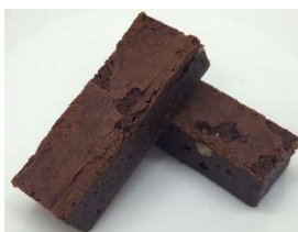
※プレゼントのブラウニー (イメージ)