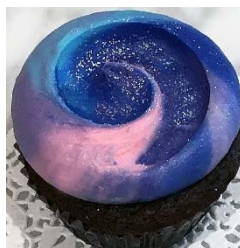
※宇宙をイメージしたカップケーキ (イメージ)