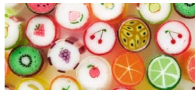
※プレゼントのキャンディ（イメージ）