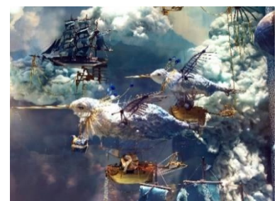
Anniversaire summer window