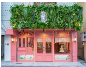
小楽園 TEA SALON & BOUTIQUE