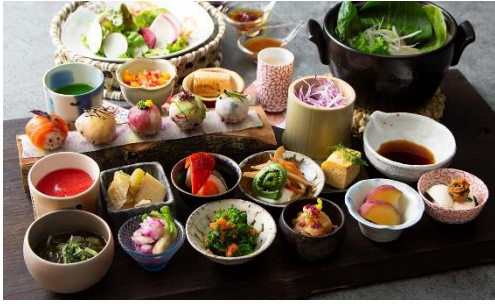
うつくしの御膳 ランチ(平日):4,800 円(税込) ランチ(土日祝):4,900 円(税込) デイナー(全日):4,950 円(税込)