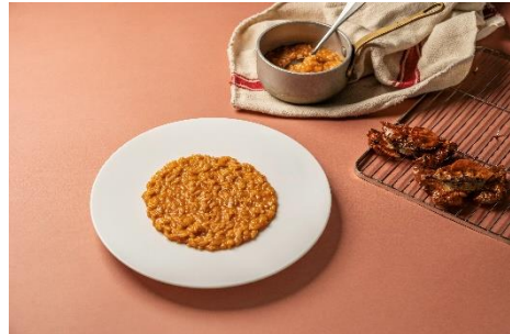
FINISH OFF - 記憶に残る メ の一皿 メ の濃厚ビスクリゾット CHEFS COURSE シェフ吉田 能のシェフズコース 5,500 円(税込)でのみ注文可 +700 円(2名様から)