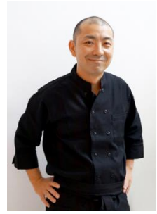
料理監修/伏木 暢頭