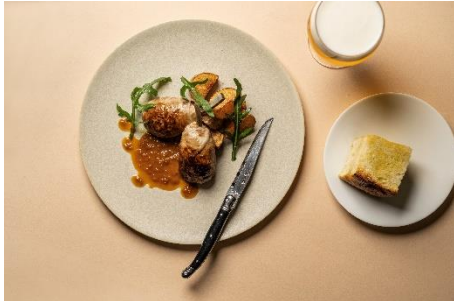
シェフが辿り着いた圧巻の仔羊ハンバーグ 2,200 円(税込)

吉田シェフ独自の視点で料理の本質を追求する料理動画のメニューが、洗練された一皿へ昇華する『SPICA』をお見逃しなく。