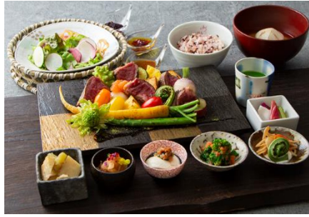
悠々と ランチ(平日):3,500 円(税込) ランチ(土日祝):3,600 円(税込) ※ディナーは販売なし